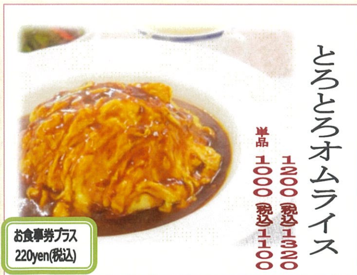
とろとろオムライス 1,200 (税込)1,300 単品 1,000 (税込)1,100