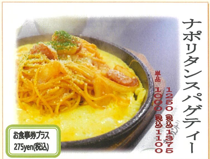
ナポリタンスパゲティ 1,250 (税込)1,350 単品 1,000 (税込)1,100