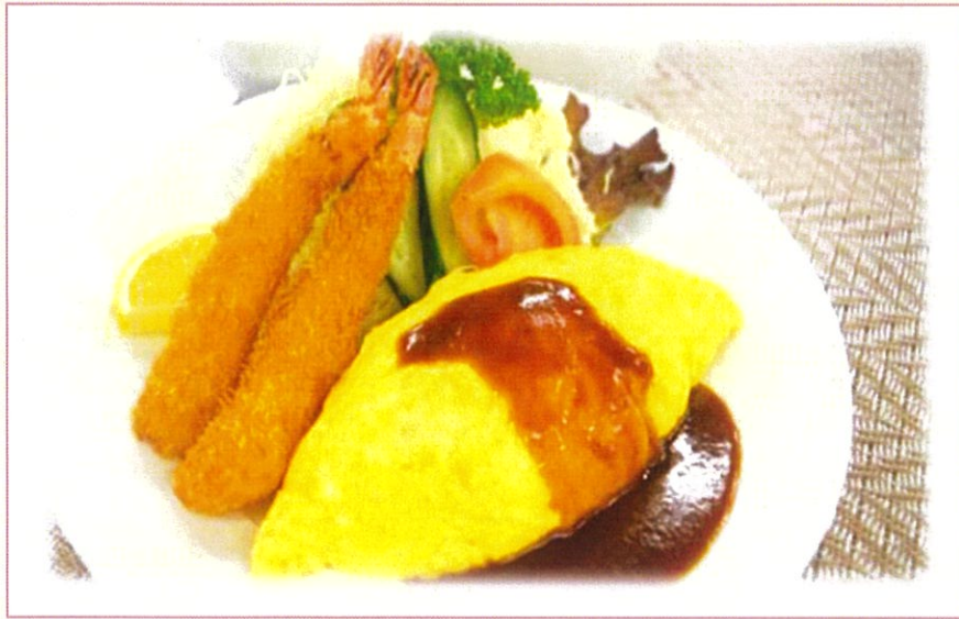
海老フライとオムライスの コンボランチ